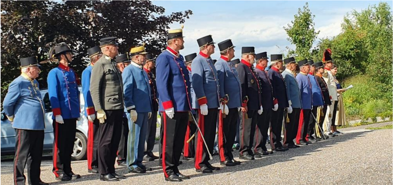
Die Delegationen des Landesverbandes treten zum Totengedenken an.

-- OÖ. Landesverband der Bürgergarden, Schützenkompanien und Traditionsverbände -- 20.08.2021, Ansfelden (OÖ)