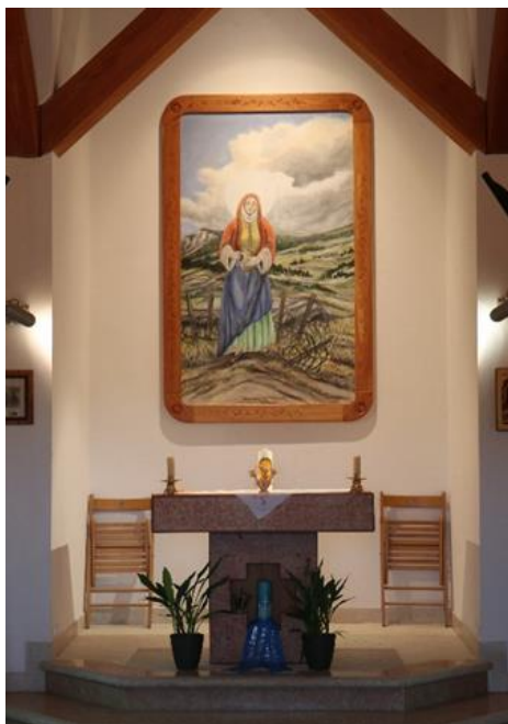
Altarbild der Heiligen Zita