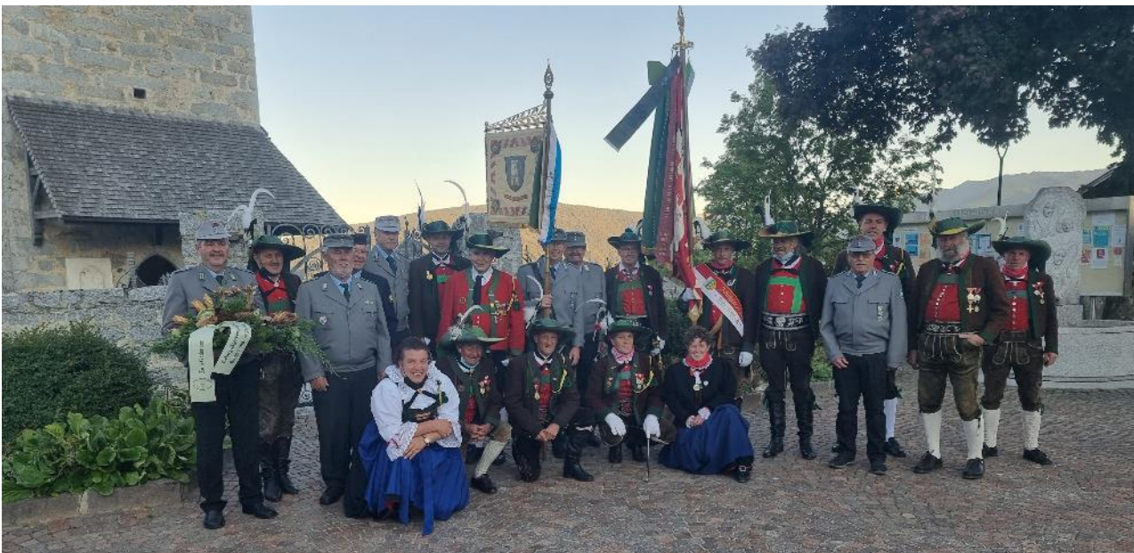
Gebirgsjäger und Schützen auf dem Kirchplatz

Danach traf man sich im Hotel zum gemeinsamen Kameradschaftsabend und konnte sich allerlei erzählen.