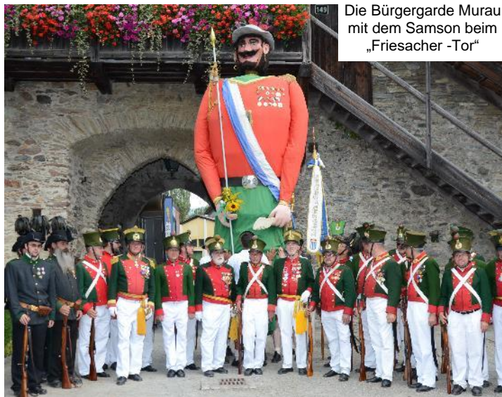
Die Bürgergarde Murau mit dem Samson beim „Friesacher -Tor“

-- Fünf Garden im Bezirk Murau sind immaterielles Kulturerbe der österreichischen UNESCO Kommission -- 01.10.2021, Murau, Ranten, St. Peter am Kammersberg, Krakaudorf, Krakaubene (Stmk)