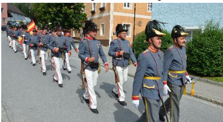
Die Schützengarde der Pfarrgemeinde St. Peter am Kammersberg in der Kaiser Jäger Uniform

Das Bestehen einer Garde in Murau reicht viel weiter zurück. Hier heißt es: Als erste steirische Stadt ist Murau von Anbeginn an beiden Flussufern befestigt. Die schon 1366 errichtete Stadtmauer weist sieben Tore auf, von denen heute noch zwei erhalten sind. Eines davon, das sog. „Friesachertor“ dient seit längerer Zeit der Bürgergarde als Quartier und Arsenal. Die Stadt Murau verfügte schon im Hochmittelalter über eine