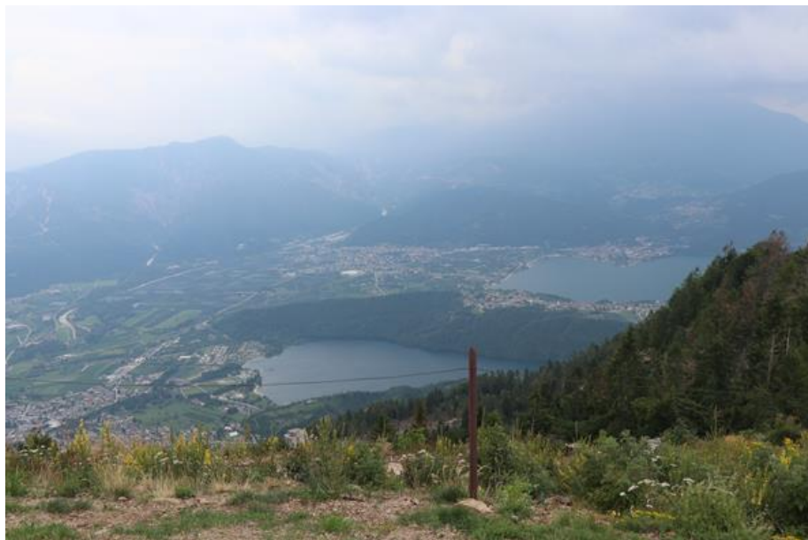
Blick vom österr. Panzerwerk Busa Grande auf den Caldonazzo und Levico See

Bei dem österr. Werk Busa handelt es sich um ein Werk der 2. Linie. Es wurde als Ersatz für die beiden alten, desamiierten, Werke Colle delle Bene und Tenne errichtet. Erste Überlegungen für das Werk wurden bereits 1906 angestellt. Im März 1915 erfolgte schließlich der Baubeginn für eine kavernierte Batterie auf Busa Grande, 23.05.1915 war die Anlage, die komplett im Felsen eingebaut ist, einsatzbereit. Die Bewaffnung bestand aus zwei 10 cm Turmhaubitzen, Modell 1905, von Skoda, unter Panzerkuppeln, aus dem