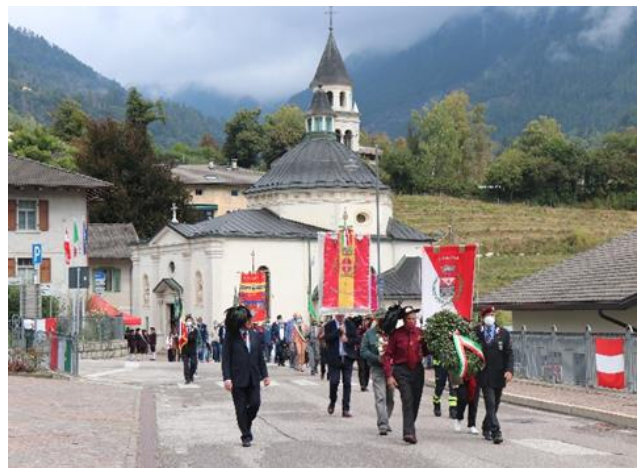
Foto und Text: Zgf. i.Tr. Ing. Karlheinz Mattern; IR59 „Erzherzog Rainer“-Salzburg Geschichtliche Abhandlung: Dr. Harald Lacom.

In Österreich hat der Vorfall ein grelles Licht auf das Problem der nichtdeutschen Minderheiten und damit die unhaltbare Lage der Monarchie geworfen.