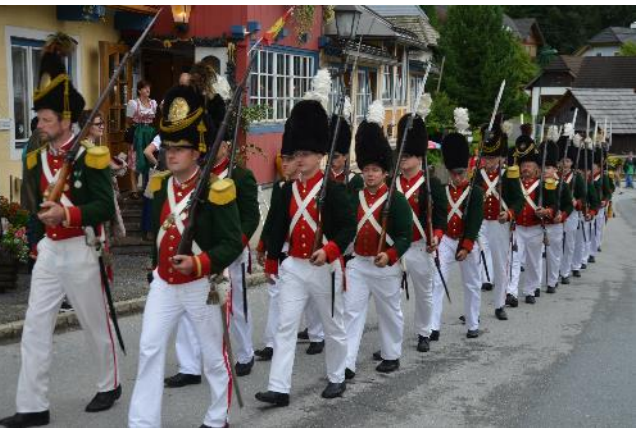
Die Schützengarde Krakaudorf hält an ihrer Tradition fest. Hoch ragt der Samson von Krakaudorf hinauf

Die Schützengarde der Pfarrgemeinde St. Peter gibt es nachweislich seit 1676, von damals gibt es eine Rechnung für die Munition zum Zwecke der Bewachung der kirchlichen Prozessionen. Diese Tradition wird bis zur Gegenwart gepflegt und es wird auch weiterhin bei den Fronleichnamsprozessionen und Peterstag die Schützengarde begleiten. Die Mannen sind in der Kaiser Jäger Uniform ausgestattet. Für den Großteil der Burschen und Männer in der Garde ist es eine Ehre, Teil der Garde zu sein. Die Funktion des Majors bzw. Hauptmannes ist in dritter Generation im Hause Leitner, vulgo Zirker. Eine Besonderheit gibt es noch in der Schützengarde, nach den Ehrensälvn wird nach den Takten der Musikkapelle die Fahne geschwungen.