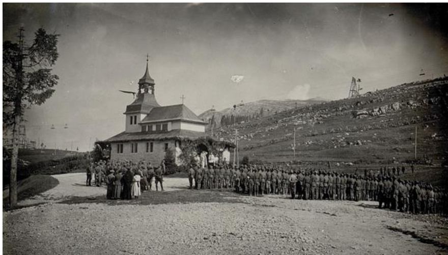
Einweihung der Zita Kapelle am 05.08.1917

einem Frontbesuch, im Juni 1917, fuhr Kaiser Karl I. an der Baustelle vorbei, nahm Kenntnis von den Arbeiten und gratulierte den Projektanten und Arbeitern und versicherte ihnen, dass die Kaiserin