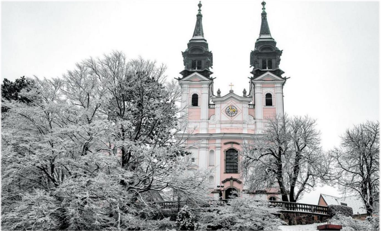
Wallfahrtsbasilika Pöstlingberg bei Linz (Oberösterreich)