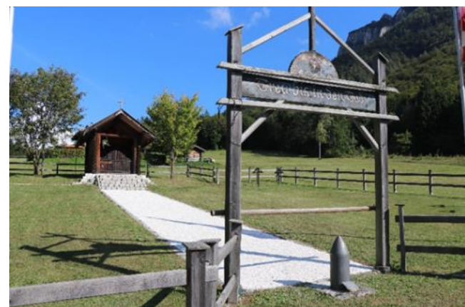
Österr. Soldatenfriedhof auf Malga Civeron