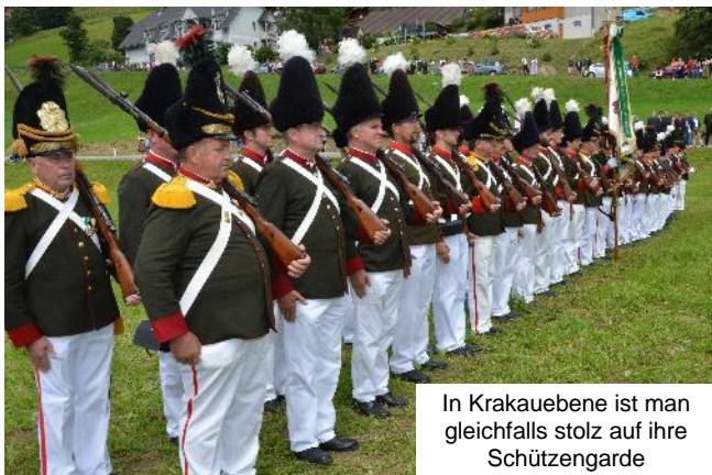
In Krakauebene ist man gleichfalls stolz auf ihre Schützengarde

Mehrere Bürger- und Schützengarden sind im Bezirksverband des Bezirkes Murau organisiert. Die fünf Garden des Bezirkes Murau sind immaterielles Kulturerbe der österreichischen UNESCO Kommission. Die Garden rücken mehrmals im Jahr bei festlichen Anlässen und kirchlichen Prozessionen aus. Die Garden fungieren als Ehrenschild bei Jubiläen, Hochzeiten und bei Besuchen von hochrangigen