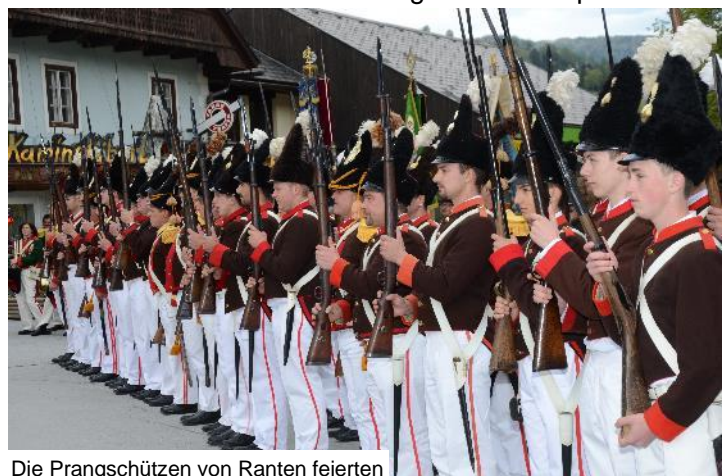
Die Prangschützen von Ranten feierten zu Pfingsten ihr Jubiläumstfest

Bereits weit vor dem Entstehen der Schützengarde wurde allerdings die Fronleichnamsprozession von den sogenannten „Prangschützen“ begleitet. Eine Tradition, die auf die Gegenreformation von 1555 und 1618 zurückreicht. Damals gab es sehr wohl einen militärischen Schutz für das diversen Prozessionen, denn Übergriffe von Andersgläubigen waren nicht einmal selten. Sechs oder acht Soldaten, entweder des Militärs oder der Bürgerwehr, flankierten in diesen Jahren schützend das Allerheiligste. Der so eingebürgerte Ehrenschatz des Allerheiligsten bei feierlichen Prozessionen erhielt bald den Namen „Prangschützen“. Prang kommt von „Prunk“ und ganz besonders im österreichisch –